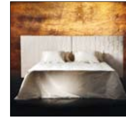
SOIRÉE Design Matteo Thun