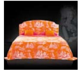
LOUIS XVI Design Treca Interiors Paris