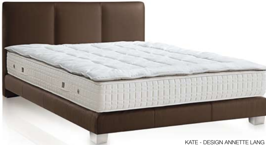
KATE - DESIGN ANNETTE LANG

Schlaf handgemacht. Klares und elegantes Design, geräumiger und luxuriöser Komfort bietet Ihnen das Polsterbett Kate, Handwerkskunst von Treca Interiors Paris sowie Design by Annette Lang.