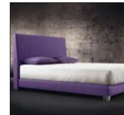
VENDÔME Design Treca Interiors Paris