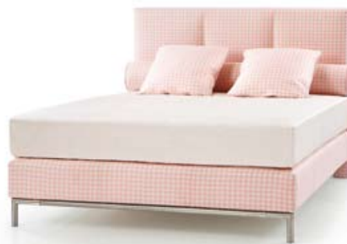
KATE - DESIGN ANNETTE LANG

Viele dieser Modelle zählen heute bei Treca Interiors Paris als Klassiker.