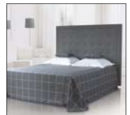
TOURNELLE Design Treca Interiors Paris