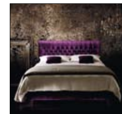
ÉTOILE CAPITONNÉ Design Treca Interiors Paris