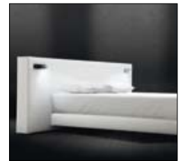
CUBE WIDE Design Treca Interiors Paris