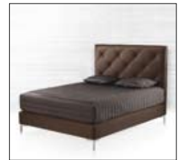
CHLOÉ Design Annette Lang